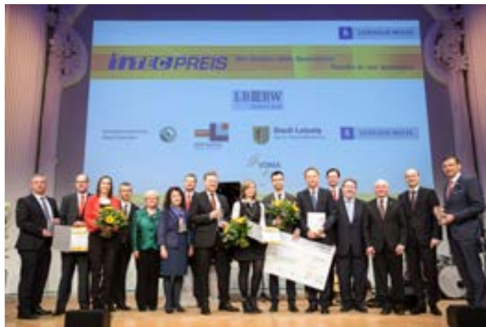
NILES-SIMMONS Industrieanlagen GmbH sicherte sich neben Profroll Technologies den Intec-Preis in der Kategorie „Unternehmen über 100 Mitarbeiter“ für die Entwicklung eines innovativen Bearbeitungszentrums, mit dem Räder für Hochgeschwindigkeitszüge unter Anwendung von moderner Direktantriebstechnik präzise, effektiv und komplett bearbeitet werden.