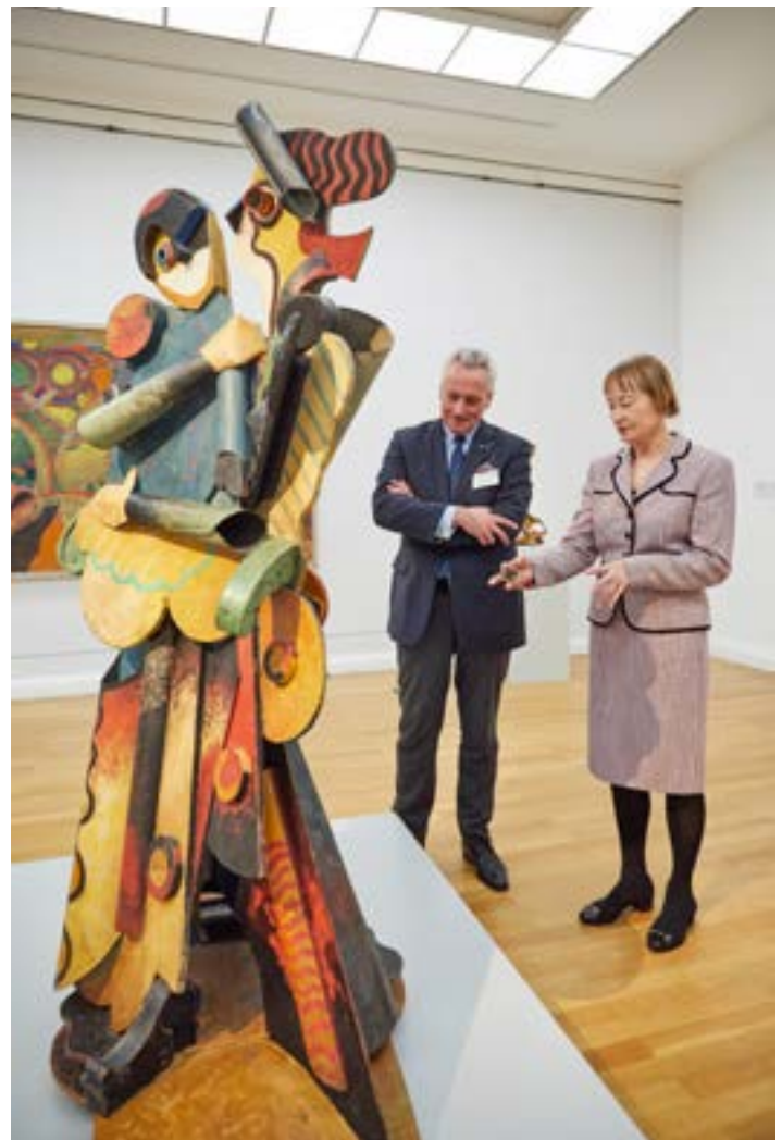
Die Kunstwerke unterschiedlicher Gattungen und Genres, entstanden in den ersten drei Jahrzehnten des 20. Jahrhunderts in Russland und in der frühen Sowjetunion, vermitteln noch immer ein belebendes Gefühl von Rebellion und Optimismus, von Modernität und Aufbruch.